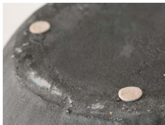
フェルトシール使用例