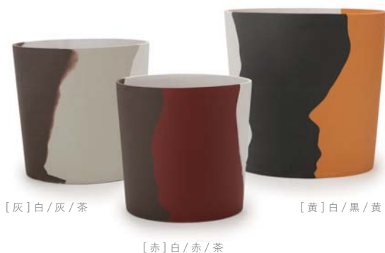
〔灰〕白 / 灰 / 茶