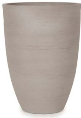
〔ウ〕ウォームグレー