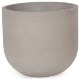
〔ウ〕ウォームグレー