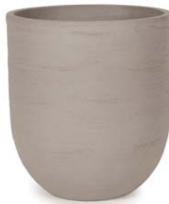
〔ウ〕ウォームグレー