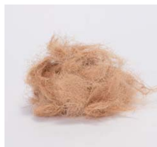
ココファイバー ベージュ