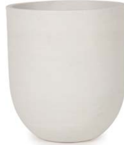
〔ホ〕ホワイトサンド