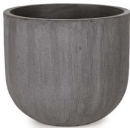
〔チ〕チャコールグレー