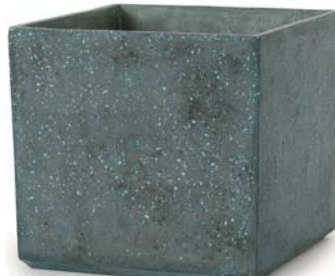
[ブ] ブルーグリーン