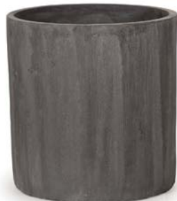
〔チ〕チャコールグレー