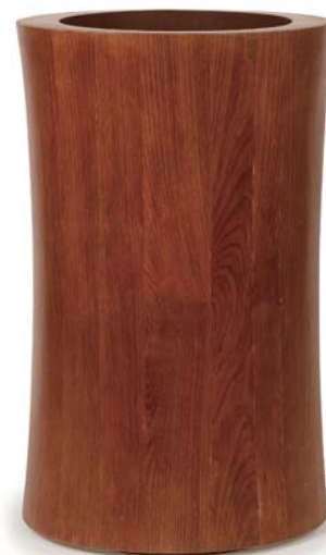
[ウ] ウォールナット