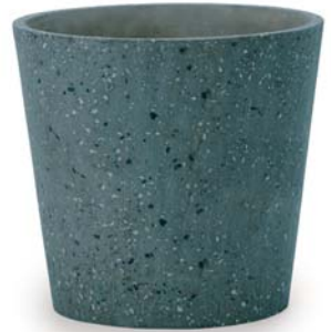
[ブ] ブルーグリーン