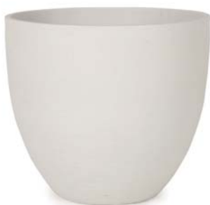
〔ホ〕ホワイトサンド