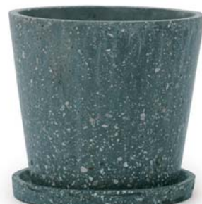
〔ブ〕ブルーグリーン