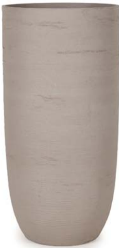
〔ウ〕ウォームグレー