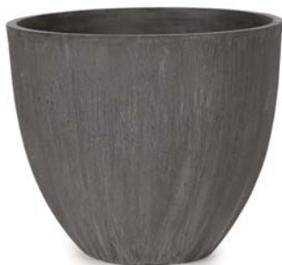
〔チ〕チャコールグレー