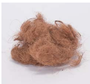
ココファイバー ナチュラル

ベトナムの古都であり、石材で有名なダナンのクラッシュストーンをマルチングストーンのラインナップに加えました。 室内観葉や多肉サボテンポットのマルチング（根本に敷いて土を隠すこと）に、やさしい風合いのピンクとイエローそして渋いグレーなど、好みに合わせてスタイリングしていただけます。まだ、1KGのネットに入っていますので手軽にお使いいただけます。 ココファイバーもより便利な小分けの50gタイプを追加。 フローリングを傷つけない鉢底フェルトシールも販売開始いたしました。