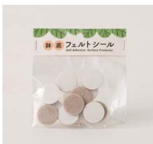
鉢底フェルトシール (12 枚入)