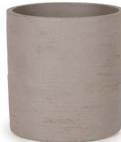
〔ウ〕ウォームグレー