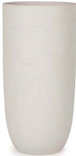
〔ホ〕ホワイトサンド