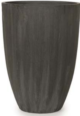
〔チ〕チャコールグレー